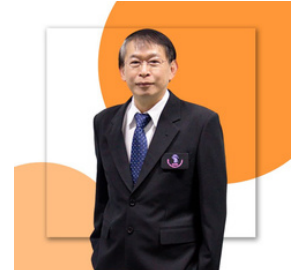
พศ.ดร.ไพรัช กาญจนการุณ รองประธานกรรมการ คนที่ 2